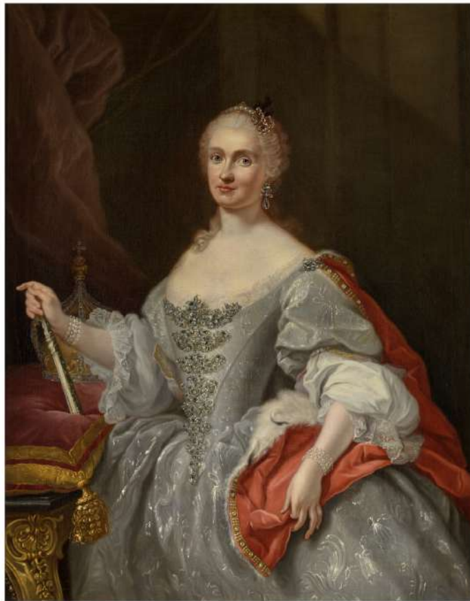
Fig. 4 - Giuseppe Bonito - La reina María Amalia de Sajonia - Museo Nacional de Prado