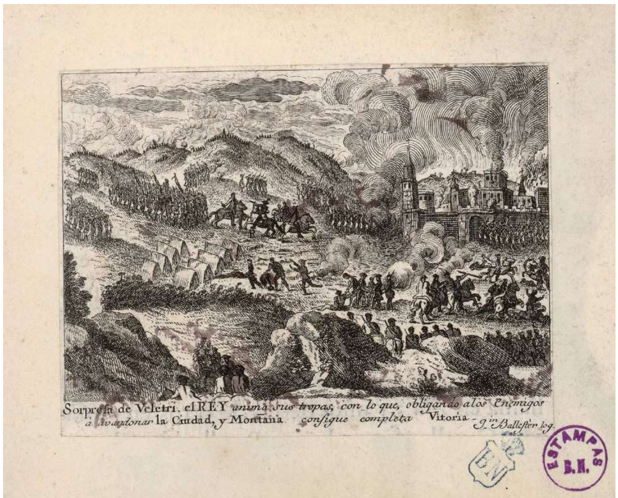
Fig. 5 - Joaquin Ballester, Sorpresa de Velletri - Biblioteca Nacional de Madrid, GE 15525