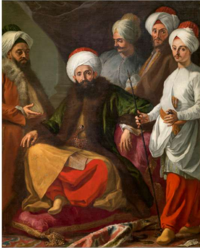
Fig. 3 - Giuseppe Bonito - La embajada turca en Nápoles , 1741 - Museo Nacional de Prado