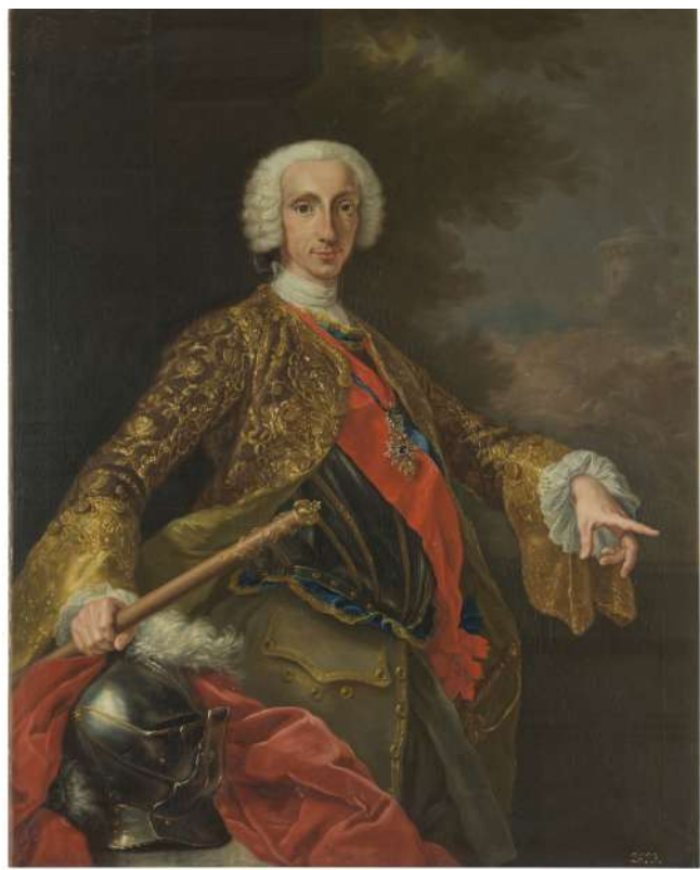
Fig. 2 - Giuseppe Bonito - Carlos de Borbón, rey de las Dos Sicilias - Museo Nacional de Prado

Este lienzo hubo de ser realizado en la etapa más importante del artista, pues encargos reales como el retrato de grupo La embajada turca en Nápoles (Fig. 3) o los de los infantes le valieron el título de pintor de corte, primero, y pintor de cámara, después. Asimismo, su buen hacer pictórico conllevó a su nombramiento como miembro de la Academia de San Lucas de Roma y director de la Academia de Bellas Artes de Nápoles convirtiéndose, así, en una importante personalidad del mundo artístico de la época.