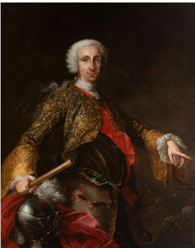
Fig. 1 - Giuseppe Bonito - Carlos de Borbón, rey de las Dos Sicilias - Galería Magalhães & Santos

Pese a que se formó con Francesco Solimena, pintor tardo-barroco italiano, paulatinamente fue creando su propio estilo, acercándose así a los delicados postulados rococós, aunque sin abandonar el intenso claroscuro que aprendió de su maestro, como se percibe en este retrato del rey Carlos de Borbón (Fig. 1), excelente versión del que actualmente se conserva en el Museo Nacional del Prado (Fig. 2).