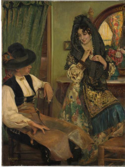
"Regalo de Boda" (1911), Museo del Prado.

Al observar con detenimiento la pincelada, especialmente tras el tratamiento de conservación y restauración llevado a cabo por doña Marta Ortiz, se aprecia una mayor riqueza y profundidad en la paleta cromática empleada por el artista. Esto se hace evidente tanto en el fondo, donde aflora una compleja gama de matices que aporta mayor hondura a la escena, como en el vestido, cuyo proceso de depuración ha permitido recuperar pliegues antes casi imperceptibles. Del mismo modo, las facciones del rostro revelan ahora un dramatismo renovado: la limpieza ha sacado a la luz una lágrima sutil, suspendida en el lagrimal derecho, mientras que el ojo izquierdo muestra un enrojecimiento más vivo, intensificando la emotividad de la mirada.