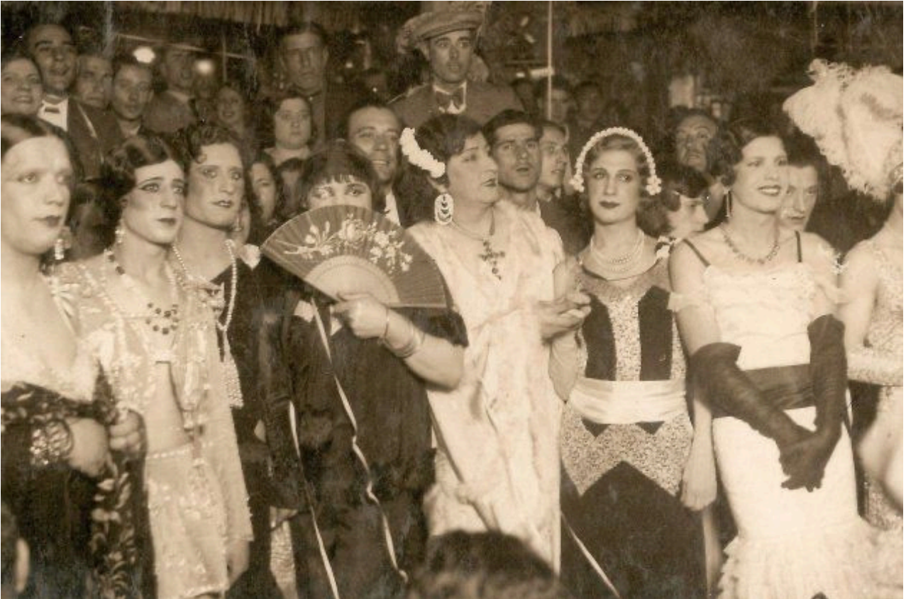
Participantes en el concurso de travestidos Miss Barrio Chino de 1934, imagen reproducida en el libro 'La Criolla'. La puerta dorada del Barrio Chino , Paco Villar, 2017.

Volviendo a nuestro retrato, es necesario mencionar que este contexto no era ajeno a Carlos Vázquez, cuyo taller se encontraba a media hora del icónico barrio Chino de Barcelona, conocido por sus espectáculos de transformismo. Es sabida también la vinculación del artista con el mítico cabaret de Barcelona Els Quatre Gats, lugar donde actuaba el famoso transformista Leopoldo Fregoli (Roma, 1867-Viareggio, 1936), quien llegó al teatro Apolo de Madrid en 1897.