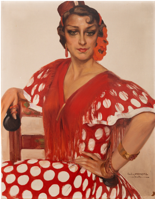
Pintura antes de limpieza