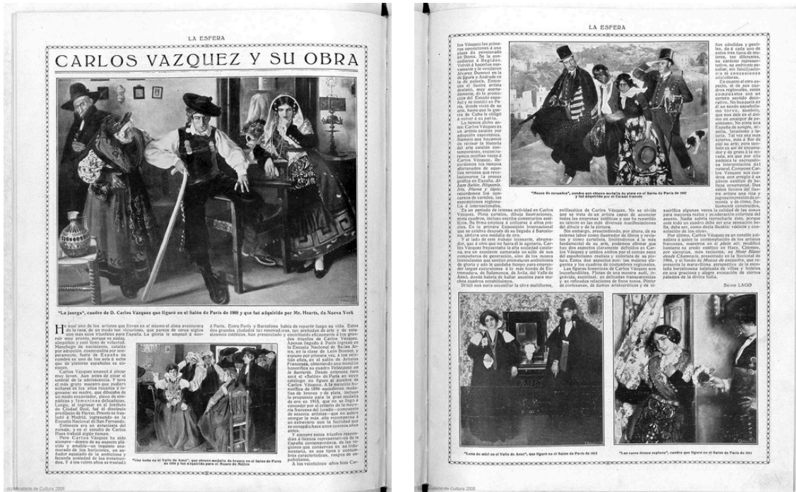
Publicación de 27 de noviembre de 1915 de la revista La Esfera. "Luna de Miel en el Valle de Anso" (segunda página, esquina inferior izquierda), pieza adquirida para la Hispanic Society of America.

En 1944 fue nombrado Miembro Correspondiente de la Real Academia de Bellas Artes de San Fernando, reconocimiento que coronaba una trayectoria marcada por el rigor técnico, la excelencia en el retrato y una constante apertura hacia los centros artísticos internacionales. Falleció en Barcelona ese mismo año, dejando una obra sólida y variada, estrechamente vinculada tanto a la tradición pictórica española como al diálogo con la modernidad europea.